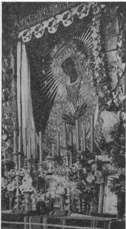
Aušros Vart altorius

Tai vis v les- ni laik papuo- šalas. Apie pavei- kslo pradži piln ž i n i neturime. Žinoma, kad nuo 1626 met aplin- kui Aušros Vart us prad jo kur- tis vienuoliai kar- melitai. Jie pra- d jo r pintis ir Aušros Vart Ma- r i j o s paveikslu,