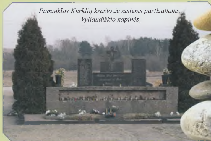
Paminklas Kurklių krašto žuvusiems partizanams. Vyliaudiškio kapinės