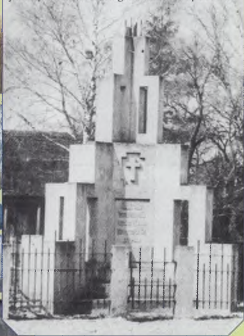
Paminklas Nepriklausomybei pastatytas 1928 m., nugriautas sovietų 1956 m.

Karo metu 1940-1953 m. Kurklių valsčiuje nukentėjo apie 1000 žmonių (apie 1/6 visų gyventojų) – tokią auką Kurklių žemė sumokėjo dvejiems Antrojo Pasaulinio karo sukėlėjams. Apie 320 žmonių buvo ištremta, žuvo virš 50 partizanų ir daugiau kaip 50 civilių, kelios dešimtys žmonių buvo suimti ir kalinami vietos ar kituose kalėjimuose, dešimtims mirtingi ar suluošinimais pasibaigę priverstinė tarnyba Vermachto ir ypač Raudonosios Armijos daliniuose, žūta Birželio sukilimo metu, 1941 m. Kurklių žydus ištikusios tragedijos metu miestelyje nebeliko nė vieno iš kelių šimtų buvusių žydų. 1944 m. kelios dešimtys kurkliečių buvo priversti pasitraukti į Vakarus.