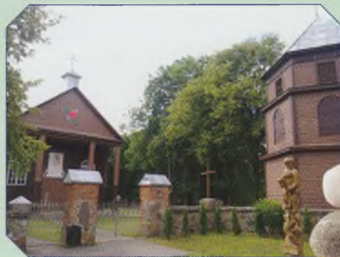
Kurklių Šv. Jurgio bažnyčia

Kurkliai pirmą kartą paminėti 1495 m., tačiau neabejojama, kad žmonės čia gyveno dar keletą šimtmečių prieš tai. Valsčiaus, dvaro ir apylinkės centras šiuo metu turi seniūnijos statusą. Nors miesteliui išskirtinesnę aplinką suteikia tik nuo seno vingiuojanti Virintos upė ir šalia XIX a. I p. nutiestas Peterburgo – Varšuvos plentas, Kurkliai gali pasigirti savo mažaisiais pasakojimais – didžiaisiais dyvais, kurie stebina ne tik vietinius gyventojus, bet ir prašalaičius.