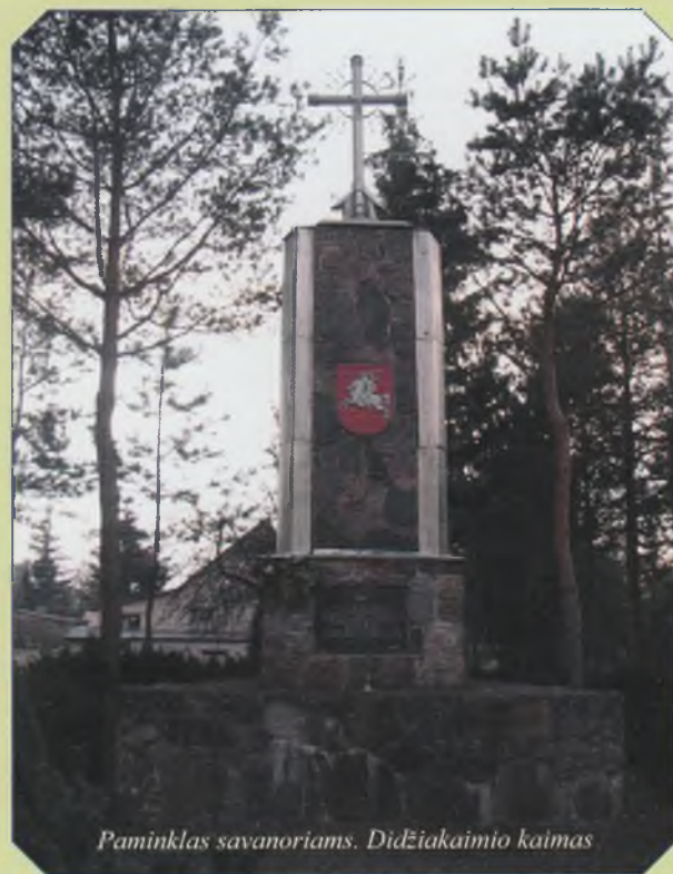
Paminklas savanoriams. Didžiakaimio kaimas

Kurklių apylinkių neaplenkė Nepriklausomybės kovos. 1919-1920 m. čia buvo kovojama su bolševikais ir želigovskininkais. 1919 m. gegužės viduryje vietos apylinkėse vyko žymiosios Kurklių kautynės, po kurių įvyko svarbus Lietuvos kariuomenės persilaužimas fronte su bolševikais . Po mūšio lietuviai ne tik sėkmingai puolė toliau, bet kartu paėmė keliasdešimt belaisvių bei vieną patranką, kuri tuojau pat buvo panaudota prieš buvusius šeimininkus. Vėliau garsioji patranka nukeliavo į Kauno karo muziejų ir tapo žymiu eksponatu. Šiame mūšyje lietuvių gretose kovėsi trys būsimieji generolai – Kazys Ladyga, Motiejus Pečiulionis ir Mikas Reklaitis . Lietuvos kariuomenės gretose visų Nepriklausomybės kovų metu kovėsi virš 30 kurkliečių. Didžiakaimio k. 1993 m. jiems pastatytas paminklas .