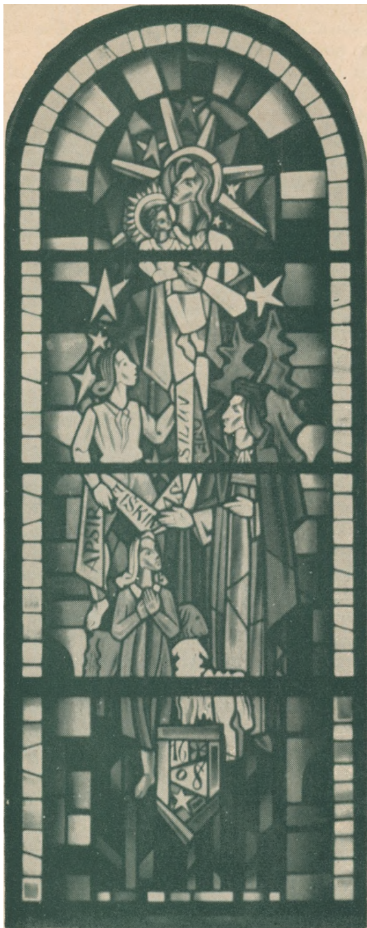
Marijos Apsireiškimo Vitražas Putname